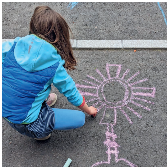
Die Kinder zeichnen Monstranzen auf den Boden.