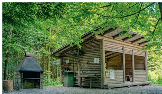
Spielnachmittag im Fuchsentanz.

Die Aktiven Familien stellen ein feines Zvieri zur Verfügung und freuen sich auf euch. Es kann auch eine Wurst oder Marshmallows gebrätelt werden, bitte selber mitbringen.