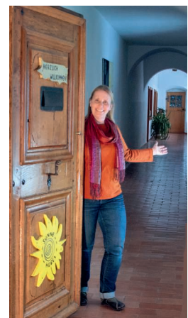
Blick ins ehemalige Kapuzinerkloster.

6.5., 10.00–17.00, Details: sonnenhuegel.org > Aktuelles