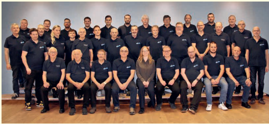
Der Männerchor Egolzwil-Wauwil gestaltet den Gottesdienst am Muttertag mit.