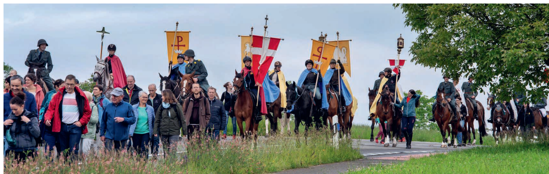
Umritt im letzten Jahr.

Auffahrt, 14. Mai, 7.00 Start bei der Kirche Altishofen