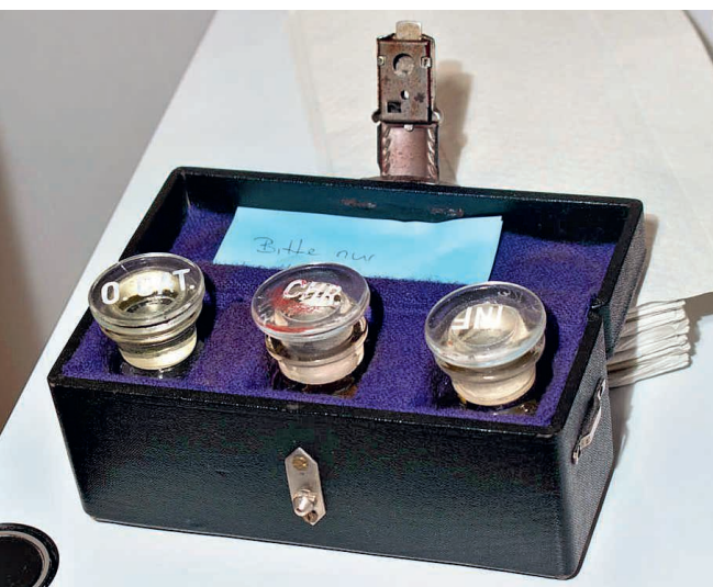
Edle Lederköffcherchen für den sicheren Transport.

Eine grosse 5-dl-Flasche mit rot-weissem Bügelverschluss bringt Priska Rüeeggsegger aus Rothenburg mit. Sie füllt sie zur Hälfte mit Chrisamöl. «Wir haben etwa 25 Täuflinge und 45 Firmlinge pro Jahr», erzählt sie. Für das Krankenöl hat sie ein kleineres Fläschchen dabei. «Am Krankensonntag kommen nicht mehr so viele Leute, um die Krankensalbung zu empfangen.» Nur vereinzelt werde ein Priester zu Menschen gerufen, um dieses Sakrament zu spenden.